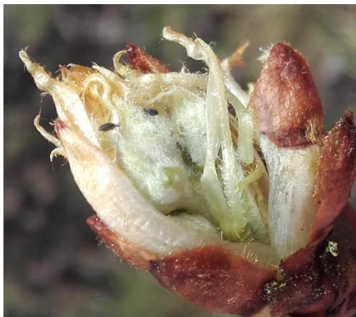
Fondatrices de puceron mauve

Ce n'est que le début des éclosions, ces dernières vont s'échelonner sur plusieurs jours en fonction des températures.