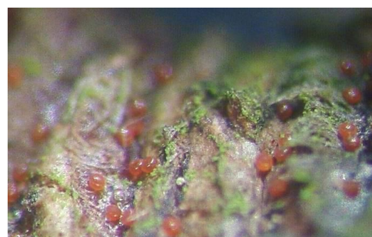
Œufs d'acarien rouge

C'est le début des éclosions, elles vont donc se poursuivre. A suivre en fonction des températures.