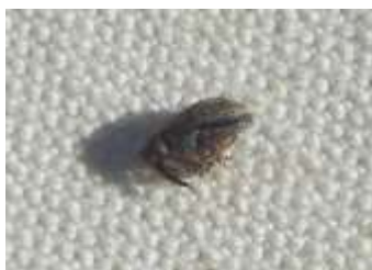
Anthome adulte immobile sur le tapis de battage