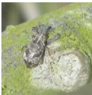
Anthome adulte (taille : 4 à 6mm)

Ils pondent dans les bourgeons des pommiers qui ont atteint le stade B/C .