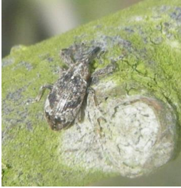
Anthonome adulte (taille : 4 à 6mm)