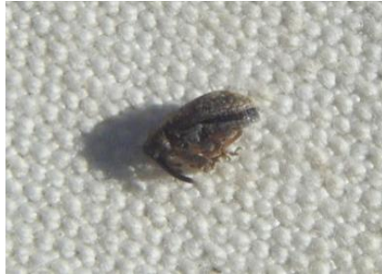
Anthonome adulte immobile sur le tapis de battage