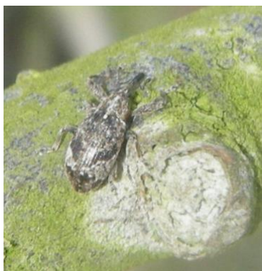
Anthonome adulte (taille : 4 à 6mm)