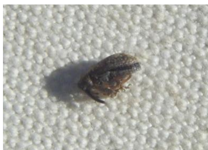
Anthonome adulte immobile sur le tapis de battage