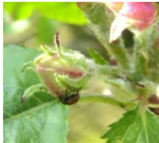
Rhynchite rouge