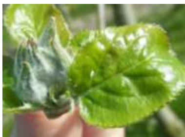
œuf de syrpe

On peut observer des œufs de syrpe en Bretagne non loin des premiers pucerons. Les larves sont de grandes consommatrices de pucerons.