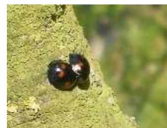
Coccinelles Exochomus adulte

Beaucoup de coccinelles adultes sont actuellement visibles. Le plus souvent ce sont des Exochomus consommatrices de cochenilles.