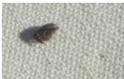
Anthonome adulte immobile sur le tapis de battage