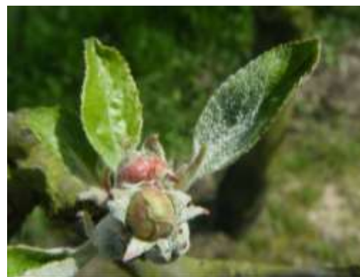
Jeune feuille oïdiée

Des contaminations primaires sont possibles dès le stade C-C3 du pommier. Les jeunes feuilles sont très sensibles et la sensibilité augmente dès le stade D3-E, où les boutons s'ouvrent et deviennent plus réceptifs.