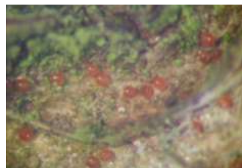
Œufs d'acarien rouge

À suivre en fonction des températures. Les éclosions devraient se généraliser.