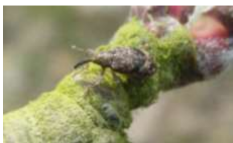
Anthonome adulte (taille : 4 à 6mm)

Ils pondent dans les bourgeons des pommiers qui ont atteint le stade B/C .