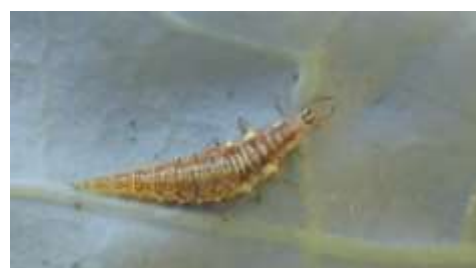
Larve de chrysope