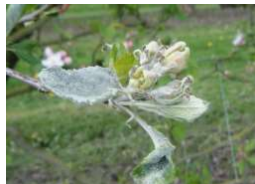
Bouquet floral oïdié

Des contaminations primaires sont possibles dès le stade C-C3 du pommier. Les jeunes feuilles sont très sensibles et la sensibilité augmente dès le stade D3-E, où les boutons s'ouvrent et deviennent plus réceptifs.