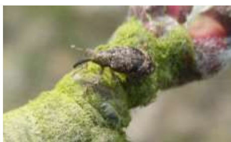
Anthome adulte (taille : 4 à 6mm)

Ils pondent dans les bourgeons des pommiers qui ont atteint le stade B/C .