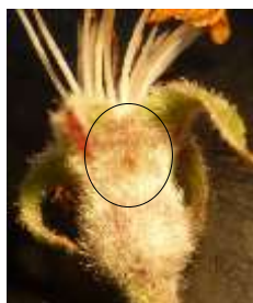
Incision de ponte

Par la suite, la larve creuse des galeries superficielles sur les très jeunes fruits, puis pénètre jusqu'aux pépins. On observe une perforation noirâtre du fruit d'où s'écoulent des déjections foncées.