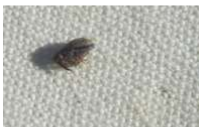
Anthome adulte immobile sur le tapis de battage