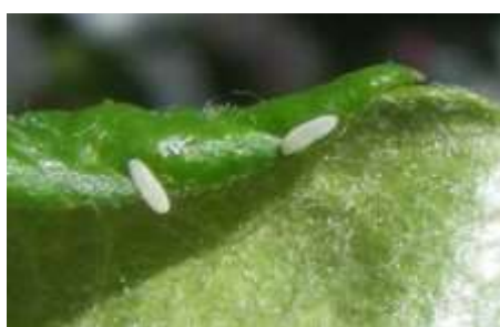
Œufs de syrpe