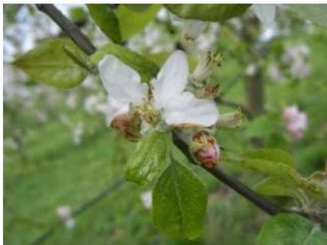
Début d'apparition des dégâts

Dégâts : la fleur de pommier prend un aspect de clou de girofle. Les fleurs ne s'épanouissent pas et brunissent parce que les larves d'anthonome, qui sont à l'intérieur, se nourrissent des pièces florales.