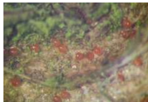
Œufs d'acarien rouge

L'acarien rouge passe l'hiver sous forme d'œufs. Ils sont de petite taille (1 mm de diamètre), ronds, de couleur rouge et pondus dans les bourrelets à la base des bourgeons.