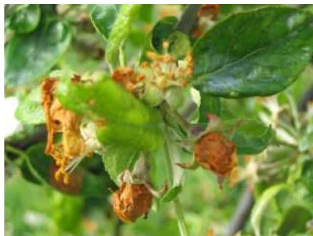
Dégâts d'anthonome : « clou de girofle »