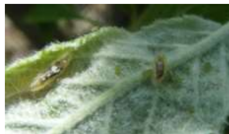
Larves de syrpe

Ce bulletin est une publication gratuite, réalisée en partenariat avec