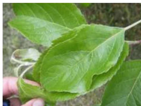
Taches de tavelure récentes

Des averses sont prévues à partir de mercredi dans les trois régions.