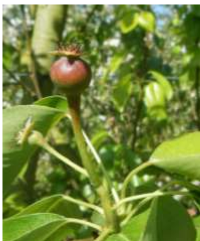
Fruit « calebassé »