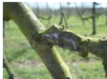
Foyer de pucerons