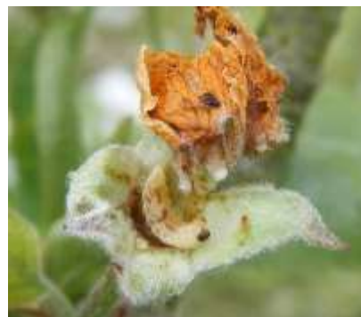
Larve d'anthome dans un « clou de girofle »