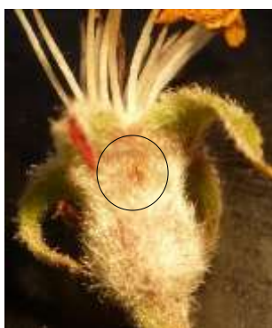
Incision de ponte

Par la suite, la larve creuse des galeries superficielles sur les très jeunes fruits, puis pénètre jusqu'aux pépins. On observe une perforation noirâtre du fruit d'où s'écoulent des déjections foncées.