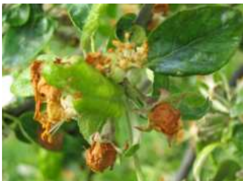
Dégâts d'anthome : « clou de girofle »

Dégâts : la fleur de pommier prend un aspect de clou de girofle. Les fleurs ne s'épanouissent pas et brunissent parce que les larves d'anthome, qui sont à l'intérieur, se nourrissent des pièces florales.