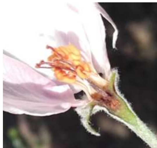
Dégât de gel

Sur fleur ouverte et qui a déjà été fécondée, le dégât peut être partiel : déformation du fruit ; ou total : chute de la fleur.