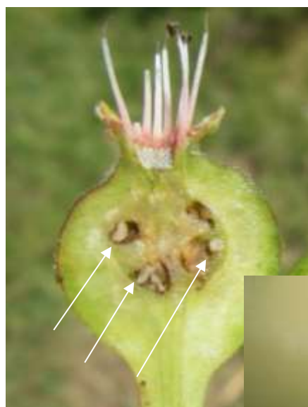
Larves de cécidomyies des poirettes dans le fruit