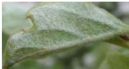
Forte population d'acariens rouges sur une feuille peu développée

Les populations devraient se diluer au fur et à mesure du développement du feuillage des arbres et diminuer avec l'action des auxiliaires.