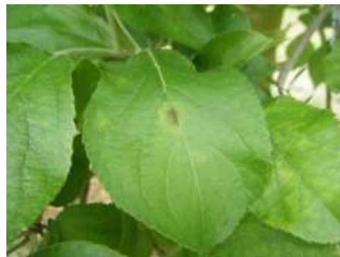
Taches de tavelure récentes

De nouvelles taches de tavelure ont été observées sur Judeline en Pays de la Loire, et parfois en grande quantité sur feuilles de rosette.