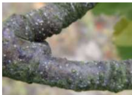
Larves de cochenilles virgules