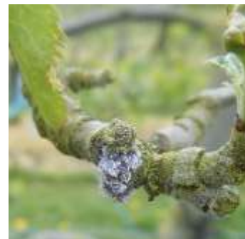
Foyer de pucerons lanigères