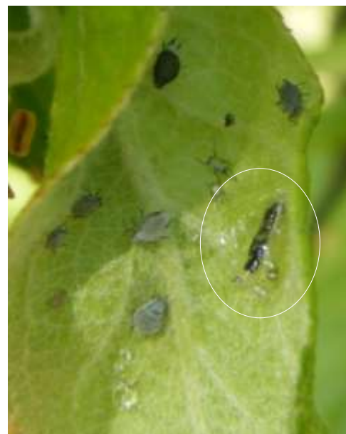
Larve de syrphe dans un foyer de puceron cendré

À suivre en fonction des températures et de la présence des auxiliaires.