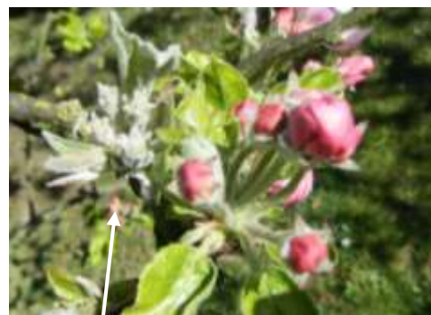
Bouquet floral oïdié

Les températures douces et une forte hygrométrie sont favorables au développement du champignon.