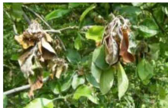
Moniliose sur fleurs

La contamination de ce champignon se fait pendant la floraison quand les conditions sont humides avec des températures assez douces.