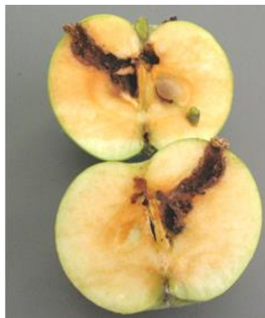
Dégâts de carpocapse