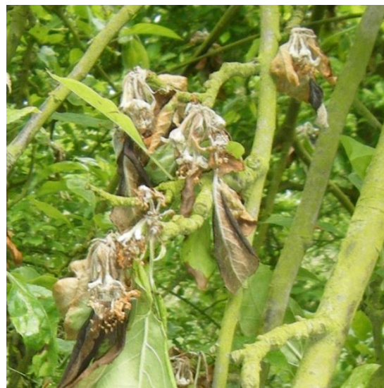
Moniliose sur fleurs