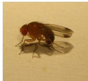
Adulte de Drosophila suzukii mâle

A suivre en fonction des conditions climatiques et de la phénologie.