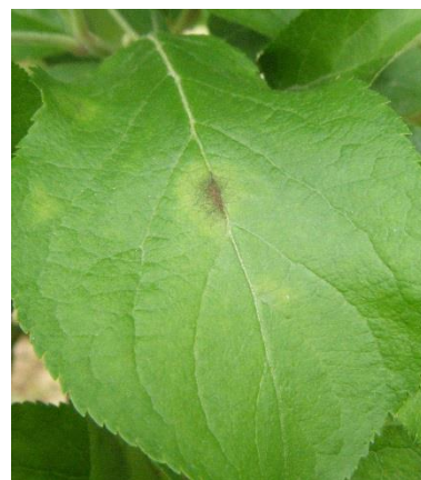
Tache de tavelure

Dans le sud Manche, les premières taches de tavelure ont été observées sur des feuilles de rosettes de variétés très précoces, suite sûrement aux contaminations de début avril.