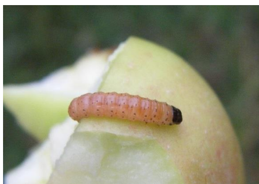
Larve de carpocapse