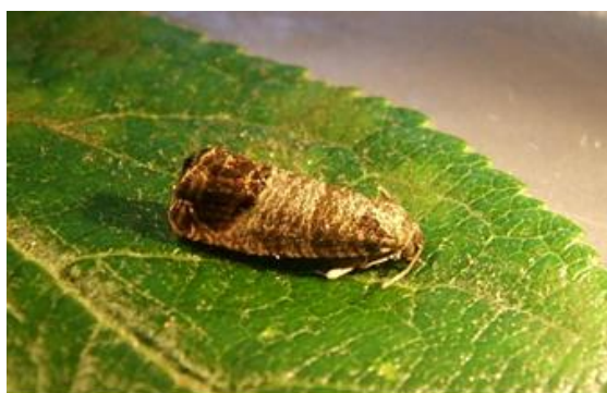
Papillon de carpocapse

La chenille mesure environ 1,5 mm à la sortie de l'œuf. Après sa croissance dans le fruit, elle atteint finalement 18 à 20 mm de long. La coloration générale est crème à rose pâle, sa tête brun foncé, avec une plaque thoracique noire.