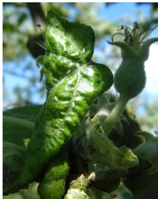
Œufs de syrphé sur feuille enroulée à cause des pucerons cendrés

A suivre en fonction des températures et de la présence de la faune auxiliaire.