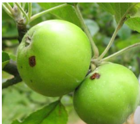
Dégâts de carpocapse

Après son stade baladeur, la chenille pénètre dans le fruit. Elle progresse vers le cœur du fruit en créant une galerie encombrée de déjections. Le fruit attaqué chute prématurément.