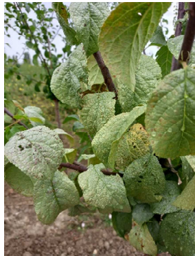
Chondrostereum purpureum = Plomb parasitaire