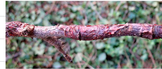
Neonectria ditissima = chaccre européen