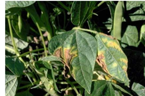
Curtobacterium flaccumfaciens pv. flaccumfaciens