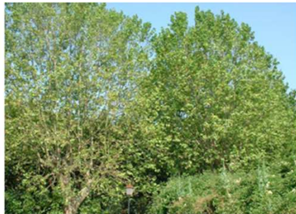
Chancre coloré du platane