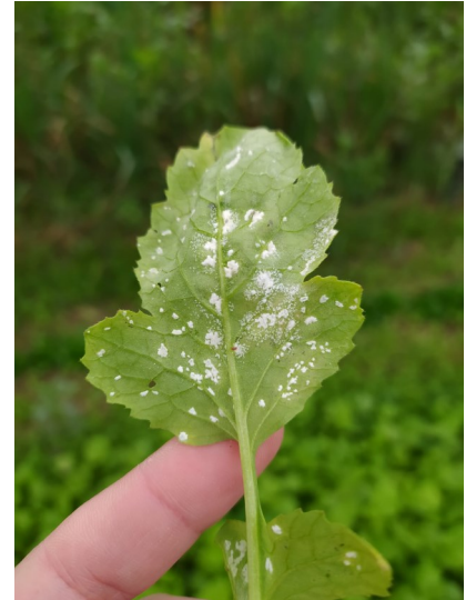
Rouille blanche sur radis