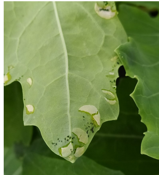
Dégâts de Xenostromylus deyrollei

A Dénezé-sous-Doué (49), en parcelle de choux, des dégâts de Xenostromylus deyrollei ont été observés sur 10% des choux.