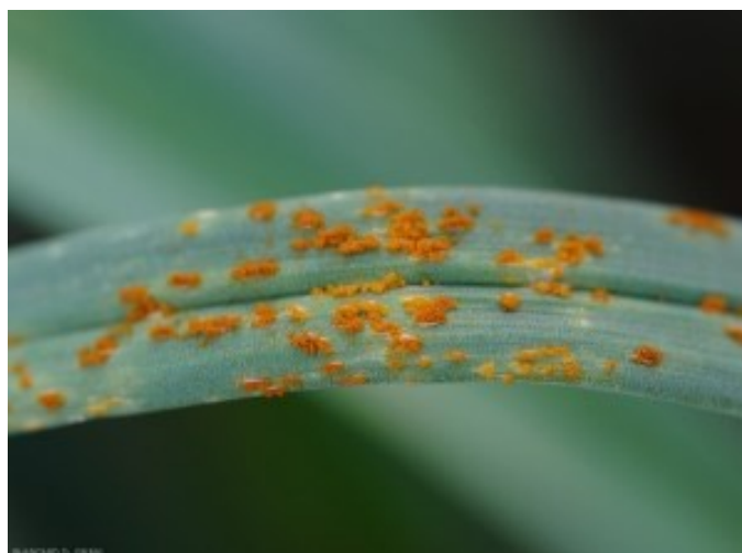
Rouille sur culture de poireaux