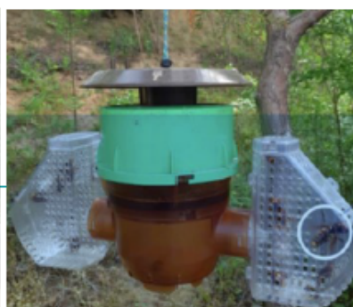
Piège coréen à ailes