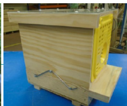
Piège nasse à grilles Néoppi jaunes