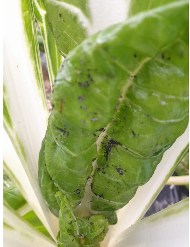
Pucerons sur cardes - Crédit photo : CDRPL

En parcelle de laitues, 15% des plantes présentent des dégâts à Dénezé-sous-Doué (49).