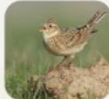
Alouettes des champs, Mel Spitz

Espèces des milieux ouverts, plaines, steppes, marais et prairies. Souvent associées et très sensibles aux pratiques agricoles.