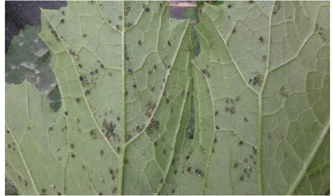
Pucerons sur courgette