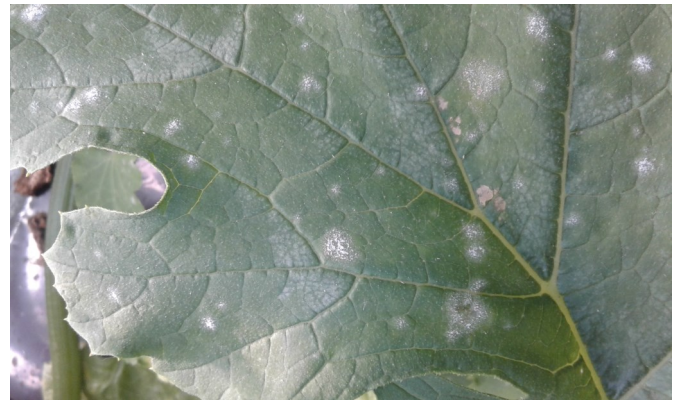
Oïdium sur courgette

En parcelle de courgettes à Cholet (49), des symptômes d' oïdium sont observés en semaine 14. La pression est faible.