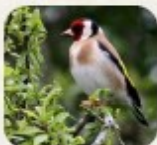
Charbonnet égyptien, Fau d'Asie

Ex : Alouettes, busards, perdrix, canards, vanneaux, oedicnèmes, outardes, petits échassiers divers, etc.