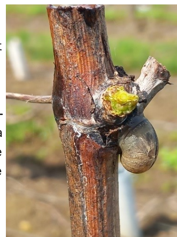
Bourgeon mangé et escargot

Le risque se situe principalement entre le stade pointe verte et première feuille étalée. L'incidence des escargots est à relativiser et est entièrement liée à la pluviométrie de la saison. La période de risque touche à sa fin, les températures s'adoucissent et devraient permettre une accélération du développement de la vigne. De plus le retour d'un temps plus sec devrait être moins favorable aux escargots et limaces.