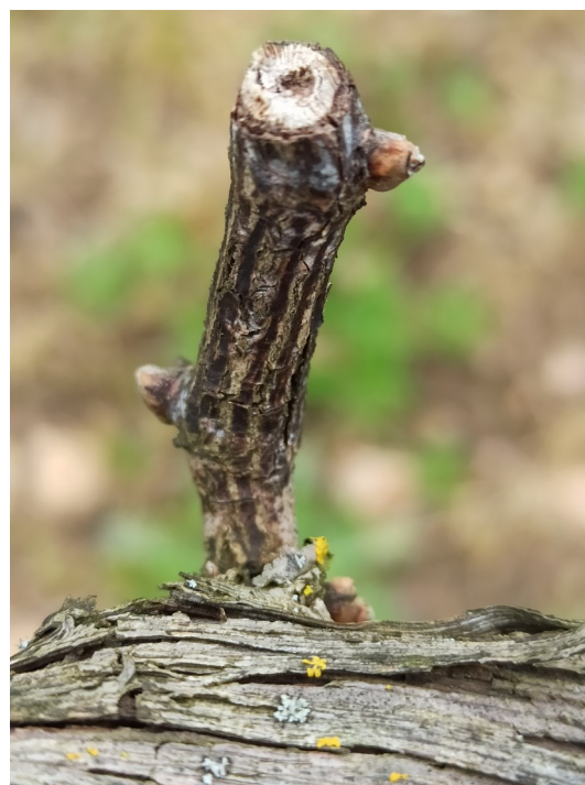
Excoriose sur bois d'un an sur Artaban

Les prochains jours n'annoncent pas de pluies significatives et prévoient des conditions plutôt asséchantes. Les conditions ne sont pas favorables aux contaminations. Vigilance sur les parcelles et les cépages sensibles (Cabernet Sauvignon, Grolleau, Chenin, Folle Blanche, Floréal ...).