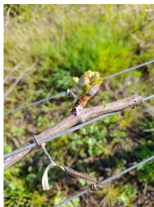
Éclatement du bourgeon sur Cot