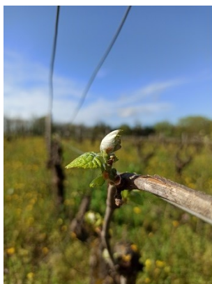
Première feuille étalée sur Melon B

La vigne gagne un stade cette semaine, le vignoble atteint le stade « éclatement du bourgeon, début du développement des feuille » (BBCH10). Les parcelles les plus tardives ont atteint le stade « pointe verte » (BBCH 07) alors que les plus précoces atteignent 4-5 feuilles étalées (BBCH 14-15). Les inflorescences sont visibles sur de nombreuses parcelles. Le débourrement est hétérogène dans les parcelles et même parfois sur un même cep. Ce phénomène est souvent rattrapé en cours de saison avec une homogénéisation des stades avant la floraison.