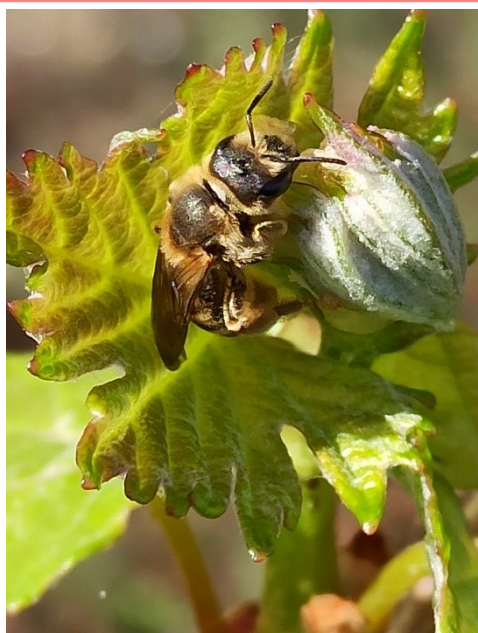
Abeille nettoyant ses antennes Si les abeilles ne sont pas nécessaires à la pollinisation de la vigne, elles peuvent occasionnellement s'y poser pour se reposer ou boire. Pour en savoir plus sur les pollinisateurs, cliquez sur l'image.