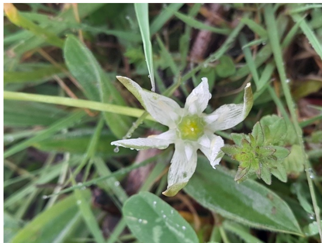
Fleur d'ornithogale

Vous souhaitez en savoir plus, rendez-vous sur le site internet du réseau : https://reseau-arbre-pays-de-la-loire.chambres-agriculture.fr/