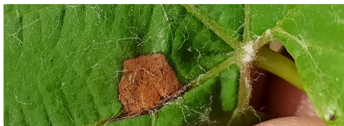
Tache de black rot sur feuille (2022)

Les conditions climatiques prévues pour la fin de la semaine (absence de précipitations) ne sont pas favorables au Black Rot. Le modèle de l'IFV ne prévoit aucune contamination dans la semaine à venir. La connaissance de l'historique de la parcelle est très importante dans la gestion du risque Black Rot, en effet les parcelles sans historique (en particulier sans historique de contamination sur les grappes) ont très peu de risque d'être contaminées.