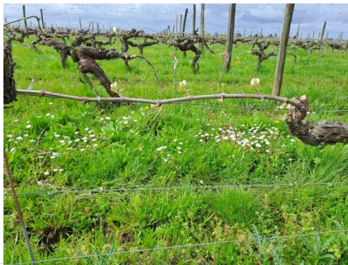
Hétérogénéité de stade - photo : L.. Dutruel LPA Edgard Pisani