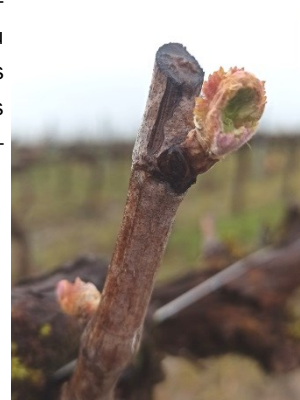
Dégâts de mange-bourgeons sur merlot

La pousse de la vigne devrait s'accélérer dans les jours à venir compte tenu de la phénologie et des températures annoncées. Une fois les 1ères feuilles étalées, les mange-bourgeons n'occasionneront plus de dégâts.