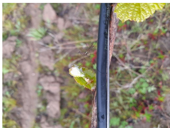
Tipule Ce diptère aux faux-airs de gros moustique ne boit pas de sang ! À l'état larvaire il se développe dans le sol et contribue à fabriquer l'humus et à aérer le sol. L'adulte quant à lui est un pollinisateur.

Les curseurs de risque utilisés ont pour objectif de synthétiser l'ensemble des informations : observations, période de risque, données météo, modèles, ... sauf lorsque cela est précisé