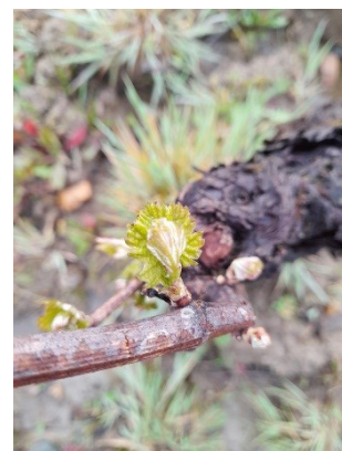
1 feuille étalée sur Gamay