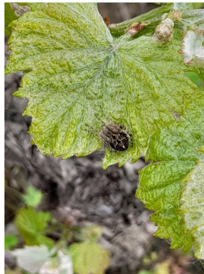
Epeire de velours

Les curseurs de risque utilisés ont pour objectif de synthétiser l'ensemble des informations : observations, période de risque, données météo, modèles, ... sauf lorsque cela est précisé