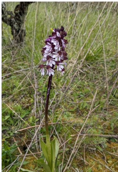
Orchis pourpre ( Orchis purpurea )

Si les porte-greffes utilisés aujourd'hui sont résistants ou tolérants au phylloxera et évitent les dégâts les plus importants, il arrive occasionnellement de trouver une galle liée à la piqûre du puceron sur les limbes des feuilles.