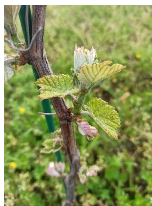
3 feuilles étalées sur Floréal