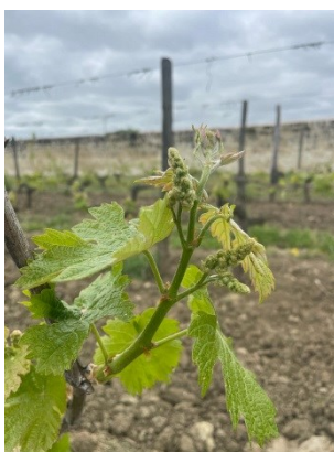
5 feuilles étalées sur Cabernet Franc

Les températures élevées de la fin de semaine dernière ont accéléré la pousse. La moitié des parcelles ont atteint ou dépassé le stade « 3 feuilles étalées » (BBCH 13). Les parcelles les plus tardives ont atteint le stade « développement des feuilles » (BBCH 10) alors que les inflorescences sont nettement visibles sur les plus précoces (BBCH 53). Le débournement est hétérogène dans les parcelles et même parfois sur un même cep. Ce phénomène est souvent rattrapé en cours de saison avec une homogénéisation des stades avant la floraison.