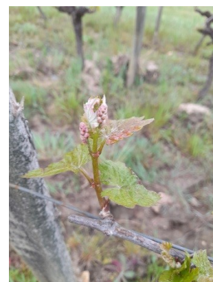
3 feuilles étalées sur Gamay

Pour consulter l'infoviti gel de cette semaine, cliquez sur l'image.