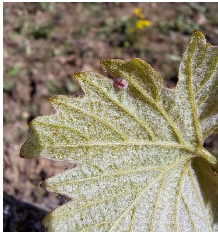
Galle phylloxérique

Si les porte-greffes utilisés aujourd'hui sont résistants ou tolérants au phylloxera et évitent les dégâts les plus importants, il arrive occasionnellement de trouver une galle liée à la piqûre du puceron sur les limbes des feuilles.