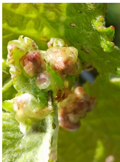
Pyrale dans un bourgeon

Le seuil de nuisibilité est fixé à 1 pyrale par cep .