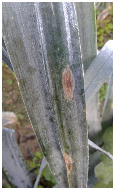
Alternaria sur poireaux