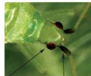
Premier article noir