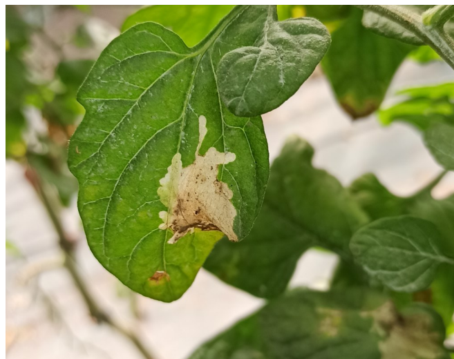
Galeries de Tuta absoluta sur tomates

En parcelle de tomate à Maulévrier (49), on nous signale la présence de noctuelles de la tomate avec des dégâts sur fruits.