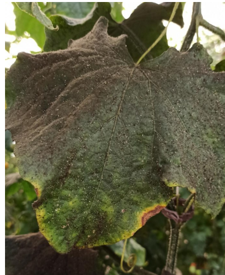
Dégâts de fumagine sur concombres

A Ste-Gemmes-sur-Loire (49), en parcelle de courgettes, 15% des plants présentent des acariens.