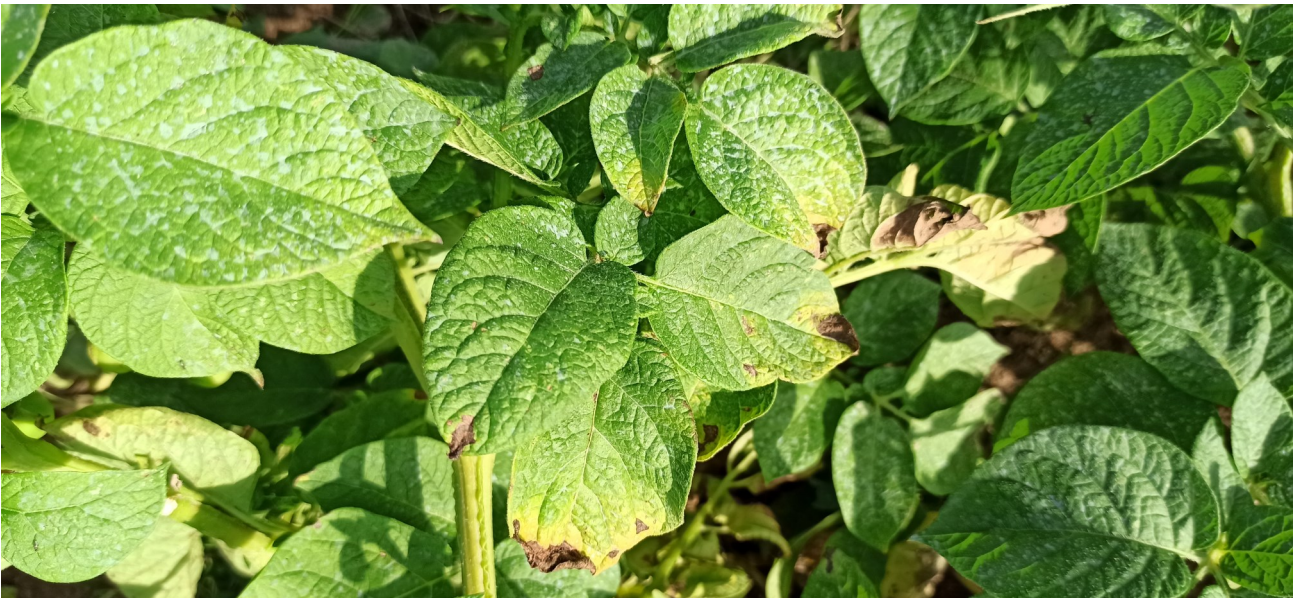
Mildiou sur Pommes de terre