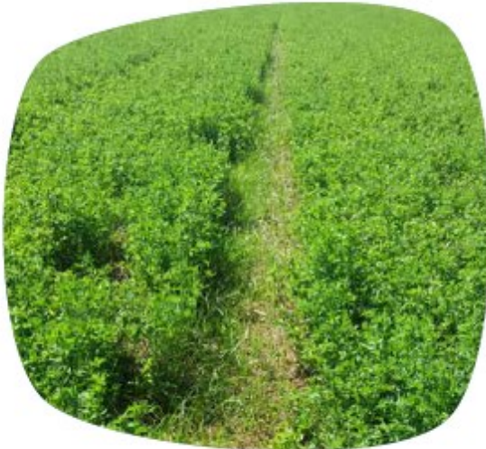
Rond de souchet dans une luzerne mal implantée