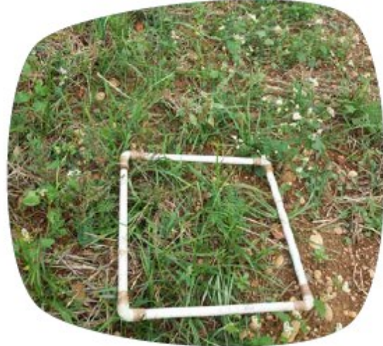
Présence du souchet dans une CIPAN