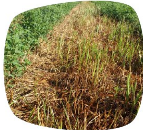
Repousse du souchet après une sécheresse