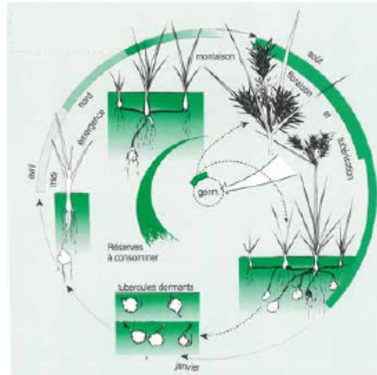
Source : Fiche Souchet, Chambre d'agriculture de la Drôme