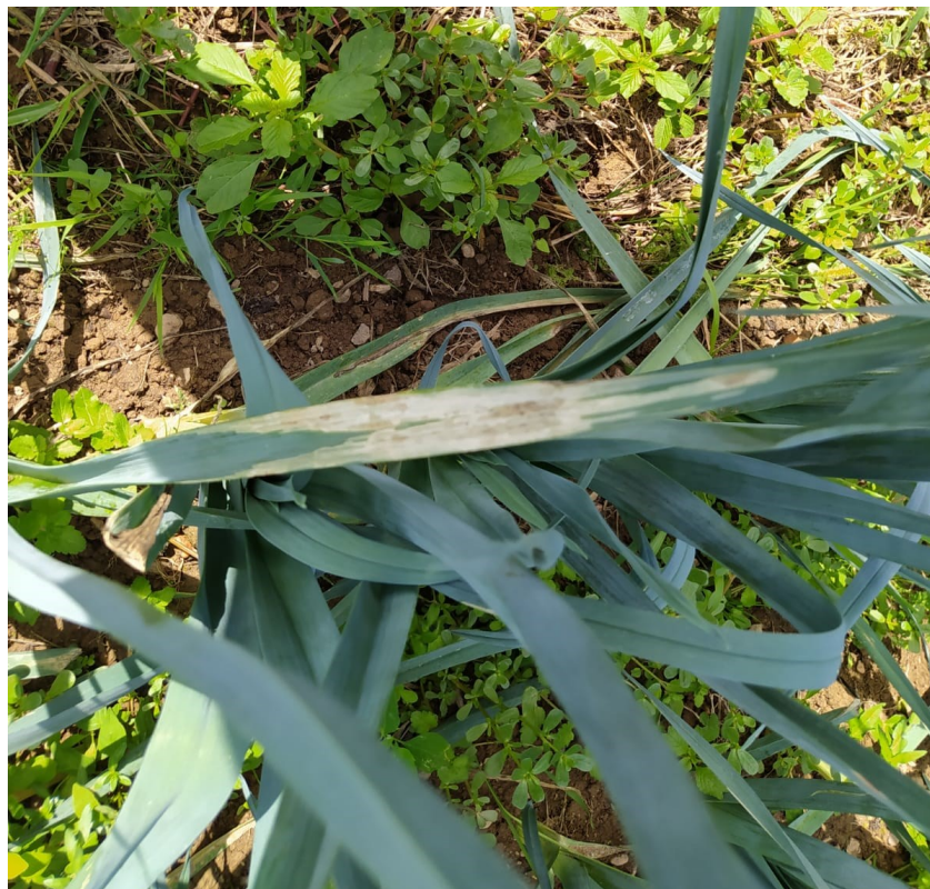
Mildiou sur poireaux