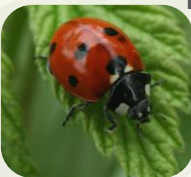
Coccinelle à 7 points.

Ex : Hanneton commun , charançons , chrysomèles , coccinelles , etc.