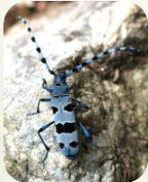
Rosalie des Alpes

Ex : Grand capricorne , Rosalie des Alpes , petite biche , etc.