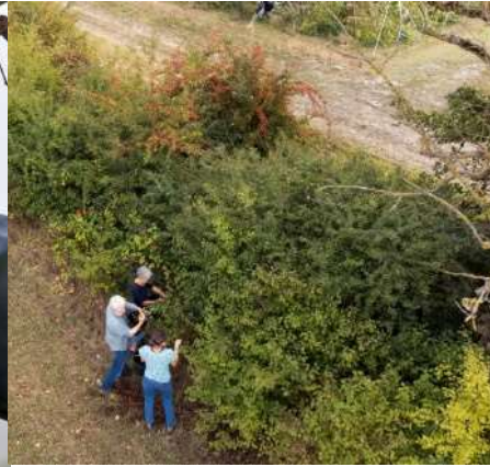
Accompagnement à la plantation et à la gestion durable

AAP national commun avec les pépinières forestières (instruction DRAAF/SERFOB)