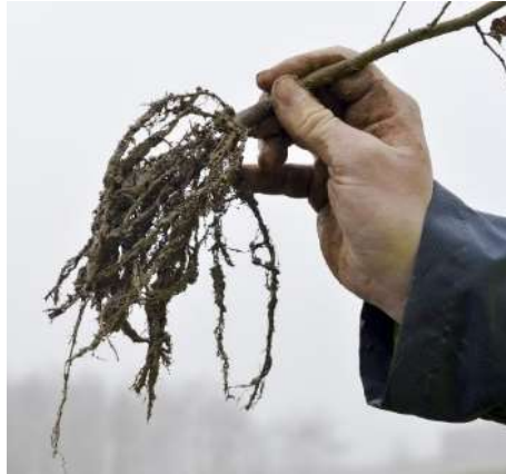
Production de graines et plants

AAP national commun avec les pépinières forestières (instruction DRAAF/SERFOB)