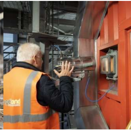
Investissement pour la filière de valorisation durable

AAP national lancé et instruit par ADEME