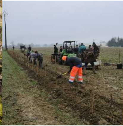
Investissement à la plantation