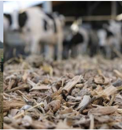
Animation pour la filière de valorisation durable