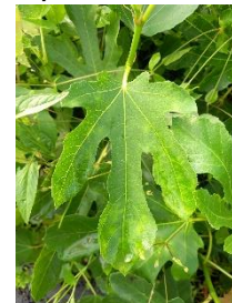
Virus de la mosaïque du figuier