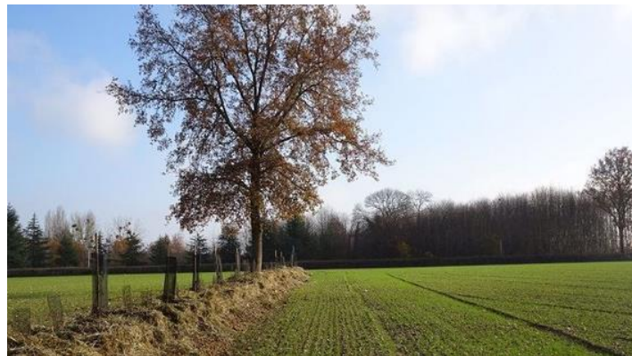
es Pays de la Loire

Pour le ministre et par délégation : Le directeur général de l'alimentation, B. FERREIRA