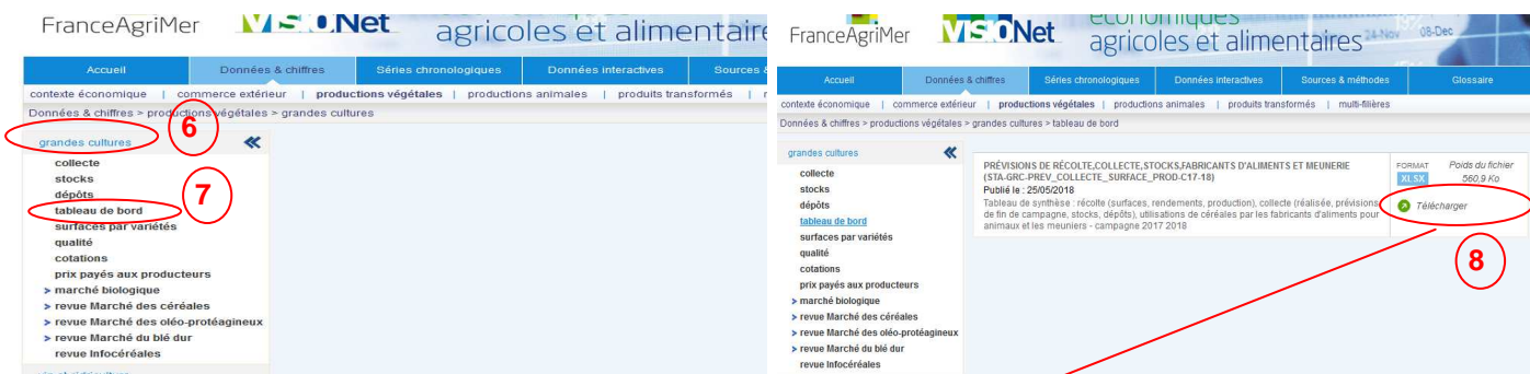
Pays de la Loire: Prévisions de récolte, collecte et stocks fin avril 2018 récolte 2017 (Surface, rendement, production, collecte prévue, collecte, stock, dépôt)