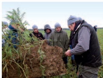
Observer l'impact d'un couvert sur le sol et sur la réduction des phytos