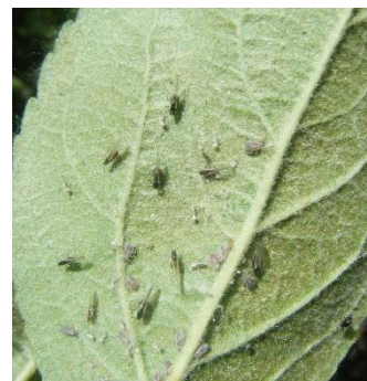
Pucerons cendrés ailés

Pour les vergers adultes (6-7 ans), suite à l'observation des premiers enroulements, réalisez une nouvelle observation la semaine suivante afin de noter la présence de la faune auxiliaire et/ou l'augmentation de la population de pucerons cendrés.