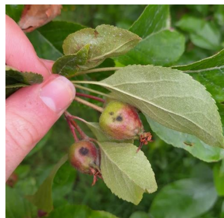
Taches de tavelure sur Judeline

Des taches sur fruits sont notées cette semaine dans quatre parcelles (deux en Normandie, une en Ille-et-Vilaine et une dans la Sarthe) sur Judeline, Bisquet et Douce Coët.