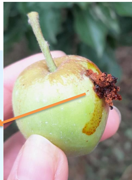
Dégât de carpocapse