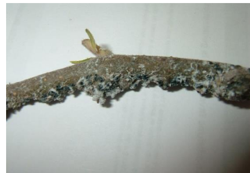
Pucerons parasités par Aphelinus mali

Observez l'activité de la faune auxiliaire : larves de syrphes, coccinelles et surtout Aphelinus mali . Ce parasitoïde spécifique du puceron lanigère permet souvent une bonne régulation naturelle de ce ravageur. Sa présence combinée aux autres auxiliaires présents va permettre une bonne régulation des populations.