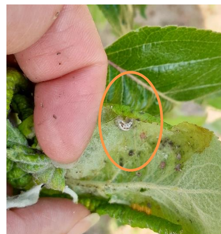
Coccinelle 7 points adulte et larve, larve de syrphe