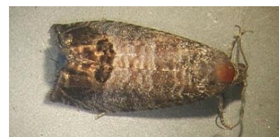
Papillon de carpodapse

Résultats des suivis des captures de carpodapse du pommier au 24/07/2024 (04/07 et 10/07 et 17/07 pour rappel).