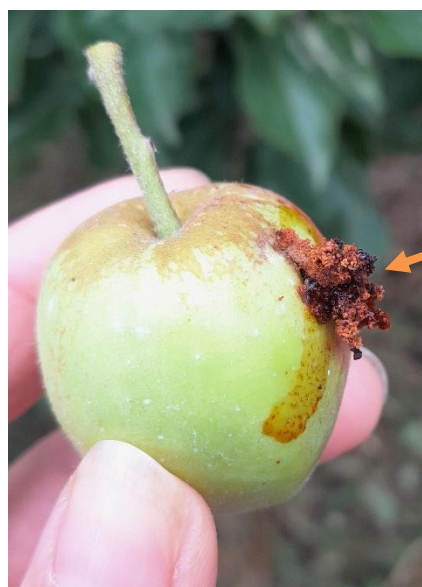
Dégât de carpocapse