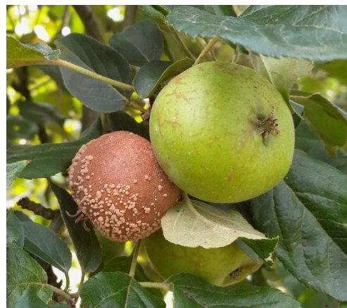
Fruit avec moniliose et fruit sain

https://ephytia.inra.fr/fr/C/21519/Pomme-Maladies-de-conservation