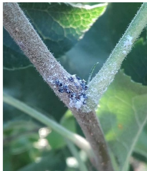
Foyer parasité par Aphelinus mali

Le risque est faible à nul. Ce parasitoïde spécifique du puceron lanigère permet une bonne régulation naturelle de ce ravageur.