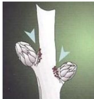
Œufs d'acariens rouges sur lambourdes à l'insertion des bourgeons