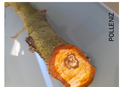
Chancres à Nectria / pommiers