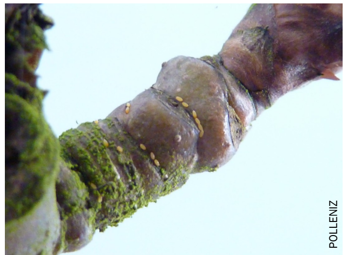
Œufs de psylles du poirier

Les conditions actuelles, peu humides, avec des températures supérieures à 10°C, sont favorables aux pontes. Les dépôts d'œufs vont s'intensifier et les futures larves auront des conditions de développement plus propices.