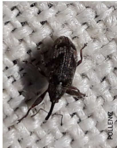
Anthonome du pommier adulte

Retirer les branches mortes ou cassées qui abritent les adultes pendant leur période d'estivation et d'hivernation (juillet à février).