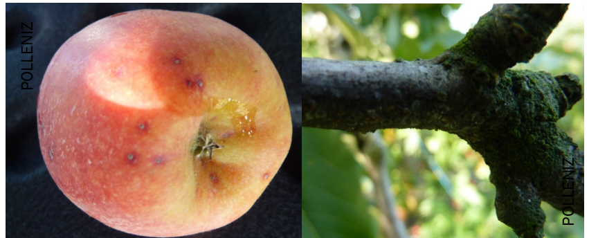
Pou de San José sur pommier (bois et fruit)

Parfois observé sur pommiers, le Pou de San José passe l'hiver sous forme de larve de premier stade (de couleur jaune) sous un bouclier blanc circulaire. Les larves sortent de diapause en février. Après plusieurs stades, les larves migrent à partir de mi-mai sur les branches, les rameaux et les fruits et forment des encroûtements. Des auréoles rougeâtres peuvent alerter de sa présence. Elles apparaissent autour des piqûres de nutrition sur fruits et jeunes branches.