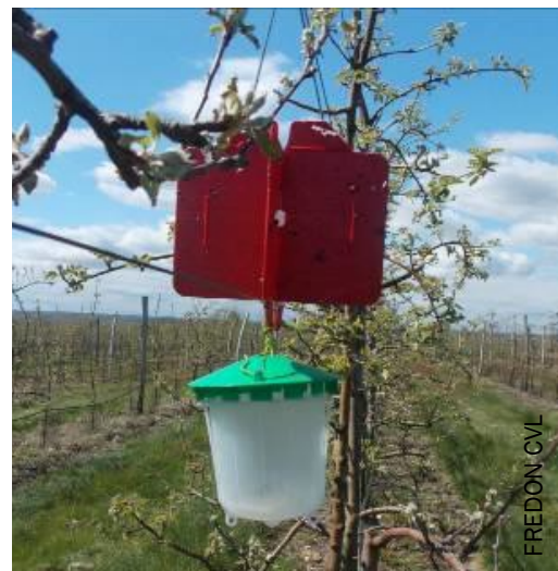
Piège olfacto-chromatique pour xylébore