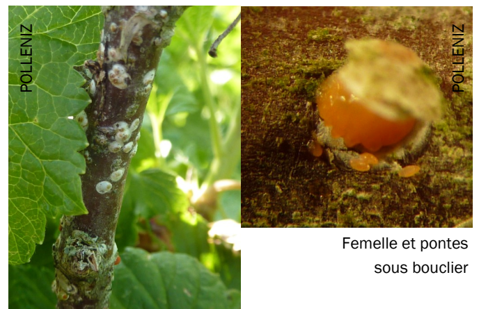
Femelle et pontes sous bouclier

On constate que les parcelles de cassissiers en souffrance (taille et irrigation insuffisantes) sont les plus sujettes aux attaques de cochenilles.