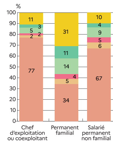
Graphique 1 Temps de travail annuel des permanents agricoles en 2020

La répartition du volume de main d'œuvre agricole par spécialisation reflète la diversité de l'agriculture ligérienne ( graphique 2 ). Dans les Pays de la Loire, la main-d'œuvre des exploitations spécialisées dans l'élevage animal, qu'il s'agisse des bovins (29 %), des autres herbivores (5 %) ou des granivores (14 %), représente encore 48 % du volume de travail total, soit 8 points de moins qu'en 2010. Les exploitations de polyculture-polyélevage regroupent 11 % de la main-d'œuvre. Les spécialisations en productions végétales emploient 40 % de la main-d'œuvre totale en ETP en 2020, en augmentation de 8 points sur 10 ans : les grandes cultures (11 %), l'horticulture (10 %), la viticulture (8 %), maraîchage (7 %), arboriculture (5 %). Cette répartition s'explique par le nombre d'exploitations et les besoins en main-d'œuvre différents selon les orientations des exploitations. Par exploitation agricole, le maraîchage et l'horticulture mobilisent le plus de