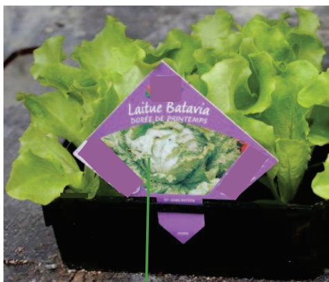
PP imprimé au dos

Exemples non exhaustifs d'apposition de Passeport Phytosanitaire :